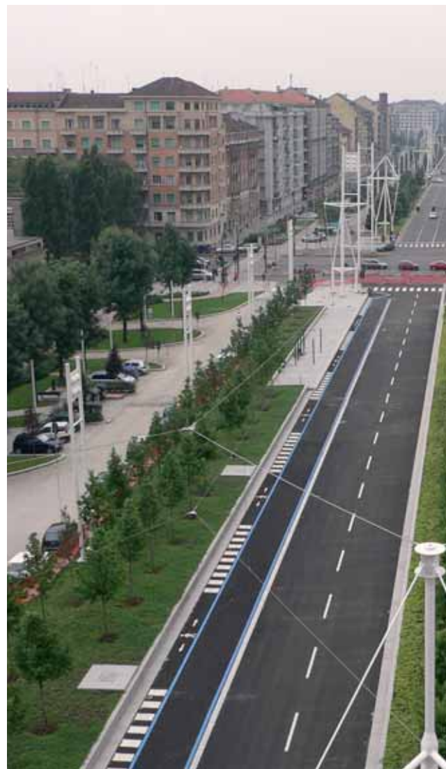
Qui sopra: Il viale di Corso Castelfidardo

alcune soluzioni architettoniche già utilizzate nel primo tratto dell'opera, caratterizzate dalla ricchezza di materiali e dal particolare sistema d'illuminazione pubblica. Una soluzione che però non penalizzerà il viale della Spina compreso tra corso Inghilterra e corso Grosseto: questo tratto rappresenta uno degli assi portanti del Piano Regolatore, caratterizzato da una sezione ispirata ai viali storici della città. In questo senso gli interventi del Passante ferroviario sono stati ispirati dalla volontà di riqualificare la zona e renderla a dimensione d'uomo e, non a caso, nel tratto compreso tra Corso Inghilterra e Corso Grosseto sono previsti 4 km di pista ciclabile che vanno ad aggiungersi ai 3 km già realizzati da Largo Orbassano. Inoltre il progetto del viale della Spina tende a "ricucire" la città anche attraverso un sistema del verde che si basa su frange capaci di fare da collante fra il viale centrale di cui sono parte e gli edifici esistenti, senza dimenticare che la copertura dei binari consente di creare ampi spazi di relazione in prossimità dei fabbricati arricchiti da un giardino lineare che accompagnerà il lungo percorso pedonale.