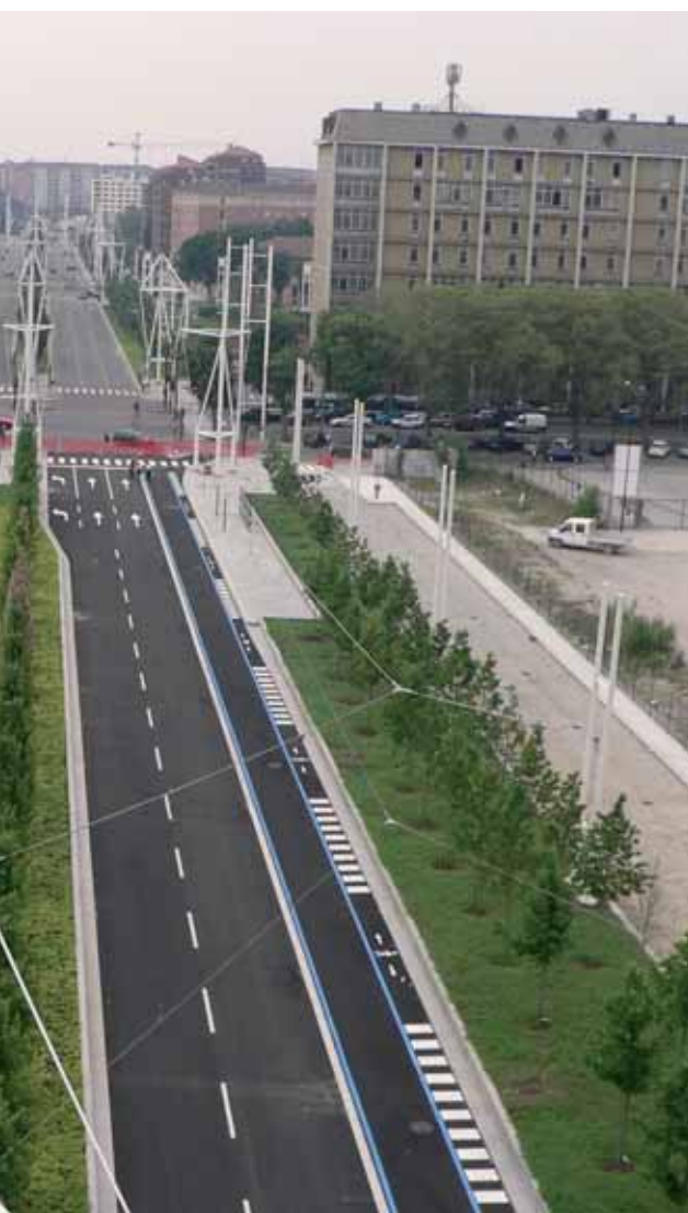
servizio Infrastrutture del Comune di Torino