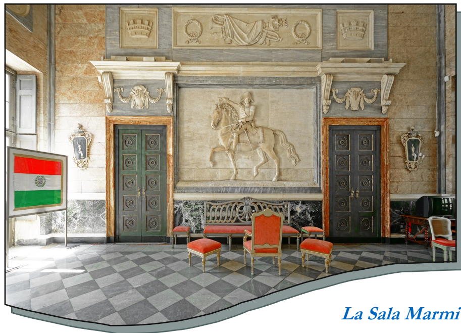
La Sala Marmi

Torino, nel riquadro di destra). Sulle pareti altre due rappresentazioni mostrano, da un lato, il Piemonte “bambino” nell’atto di difendere lo stemma della città a spada tratta; dall’altro, il genio d’Italia che sorregge la corona sopra lo stemma di Roma, indicando così gratitudine verso la nuova capitale nonché la civiltà fondatrice della colonia Augusta Taurinorum . Proprio sotto quest’immagine troviamo l’asta finemente decorata della bandiera d’onore, donata nel 1898 dalle città italiane, in occasione del 50° anniversario della concessione dello Statuto Albertino.