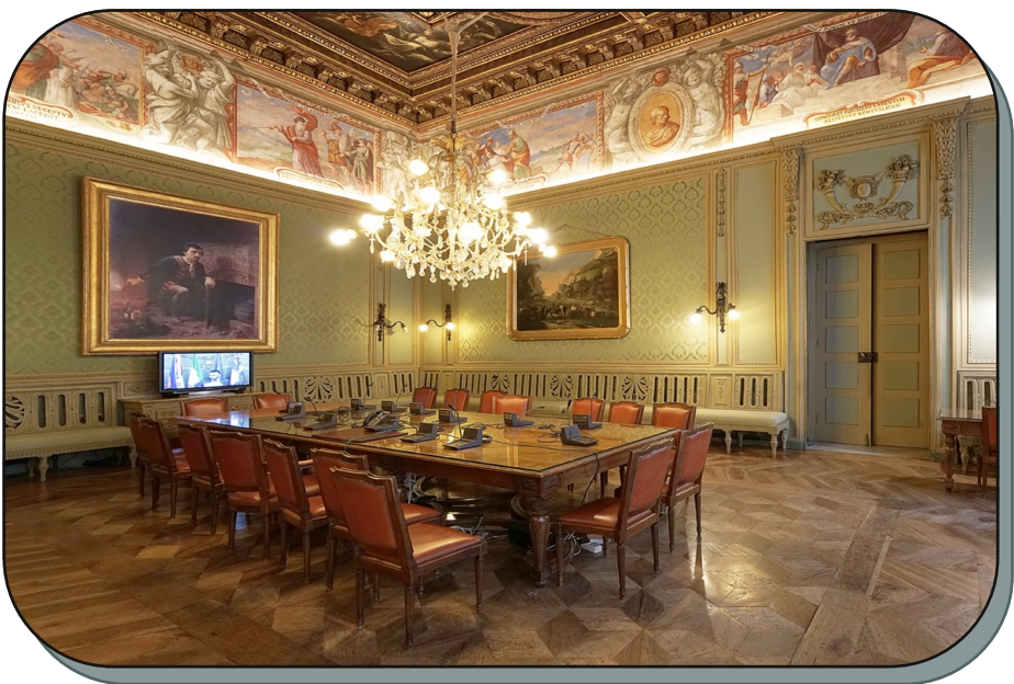
La Sala del Consiglio o Sala Rossa

La sala non faceva parte del progetto originario, ma fu aggiunta nell’intervento a opera dell’architetto reale Benedetto Alfieri nel 1758. Una delle prime sale consiliari costruite in Italia, non adotta il modello semicircolare tipico