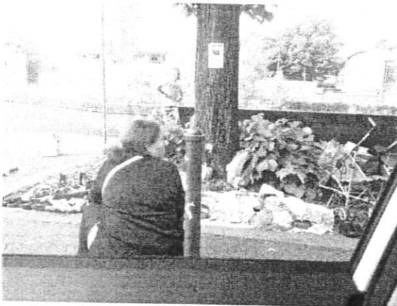
15/9/2018 Lungo Dora Napoli