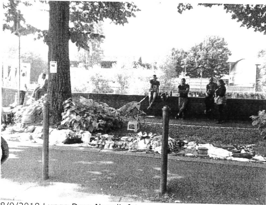
8/9/2018 Lungo Dora Napoli