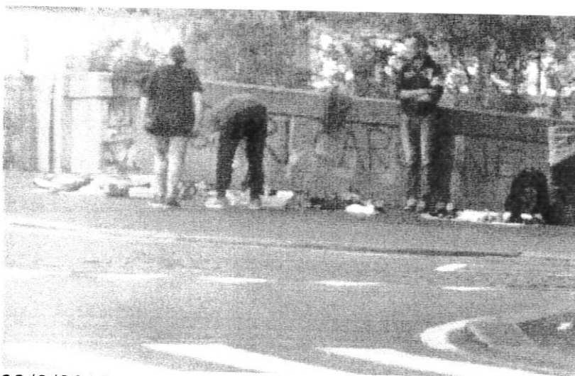
22/9/2018 ore 9 Lungo Dora Napoli