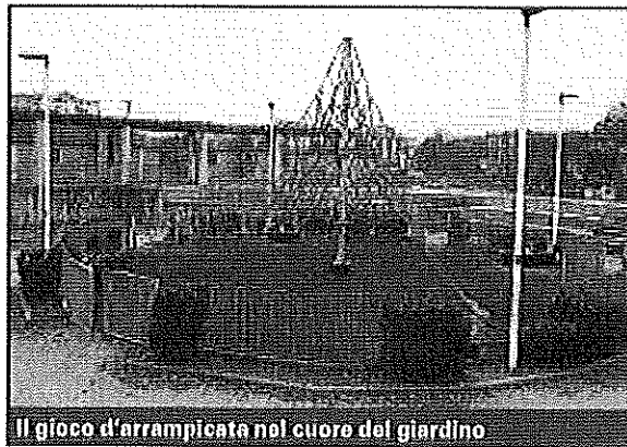
Il gioco d'arrampicata nel cuore del giardino