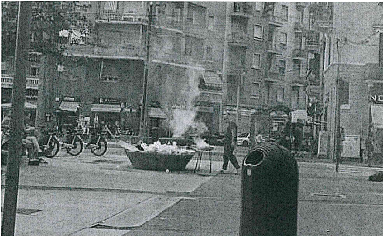
Grigliata Largo Brescia