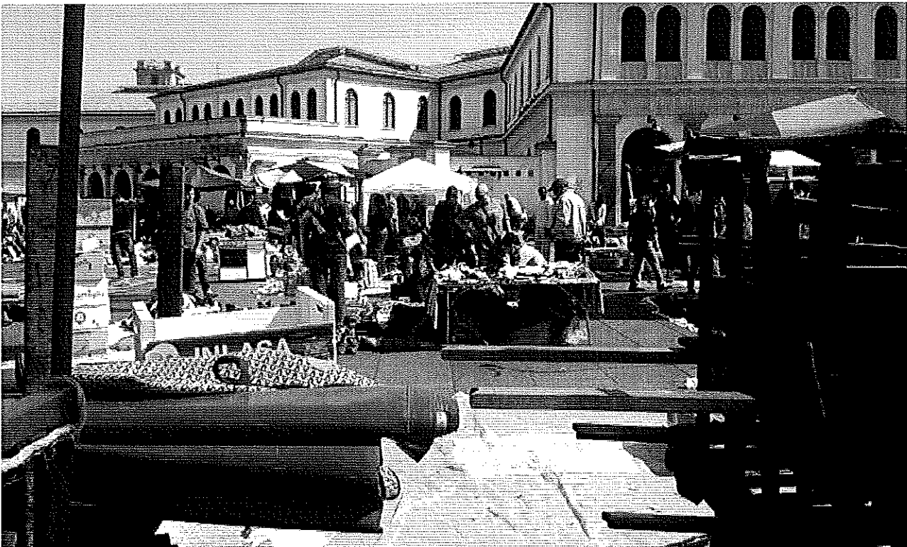
6 aprile 2014 Porta Palazzo Suk abusivo