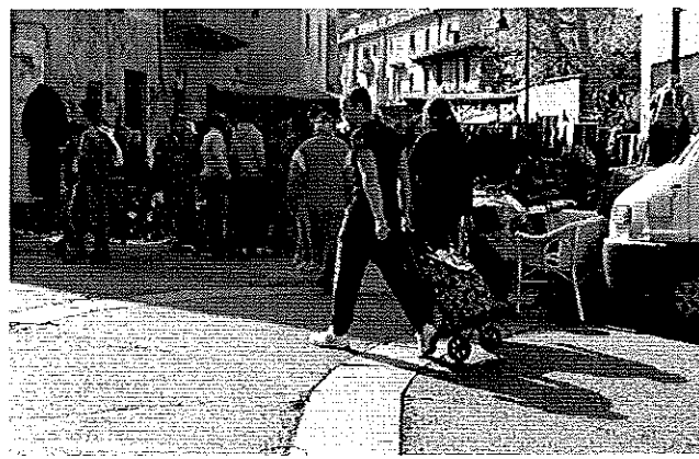
5 aprile 2014 Canale Carpanini