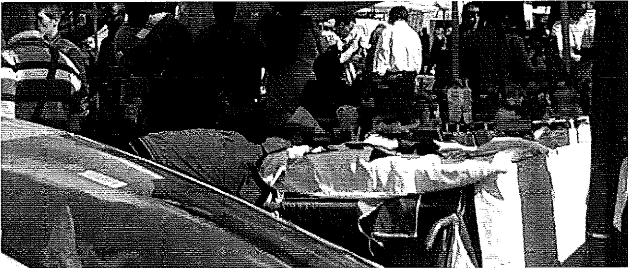
6 aprile 2014 Porta Palazzo Alimenti nel Suk abusivo