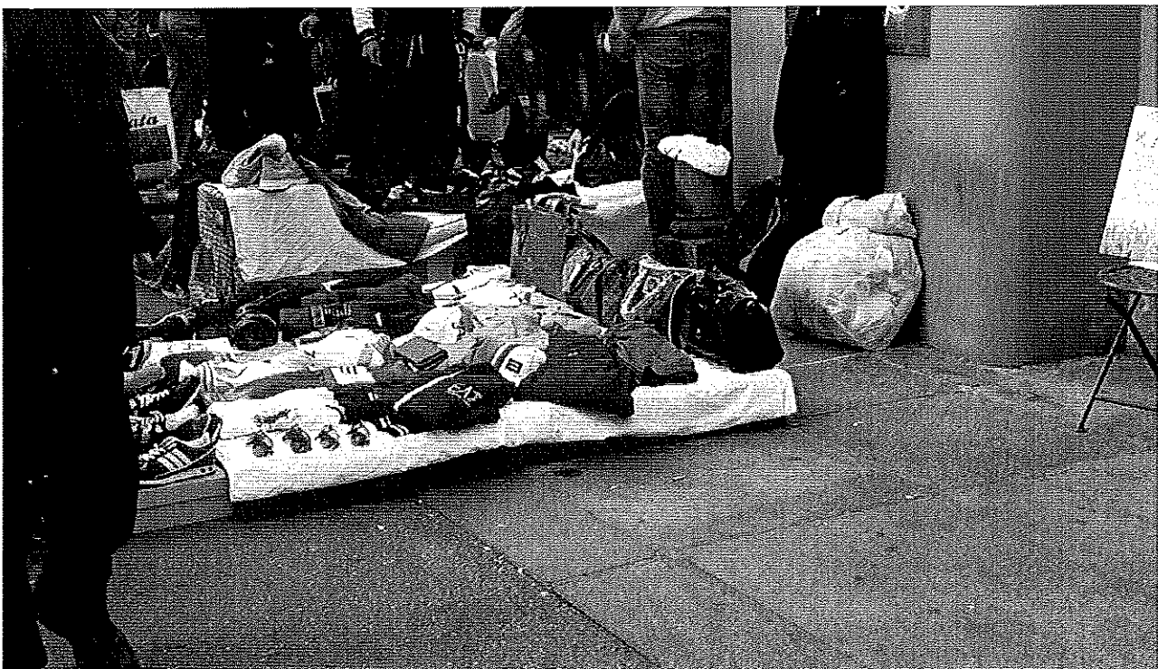
5 aprile 2014 Via Mameli angolo Canale Carpanini