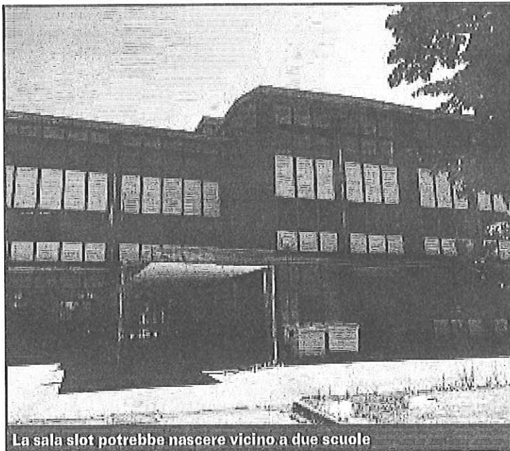
La sala slot potrebbe nascere vicino a due scuole