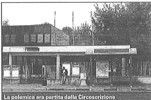
La polemica era partita dalla Circoscrizione