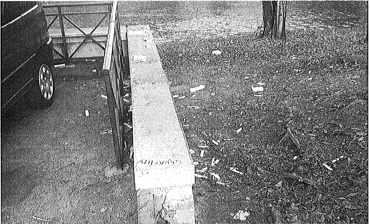
20.12.2015 Lungo Dora Agrigento tratto Ponte Mosca- Sermig