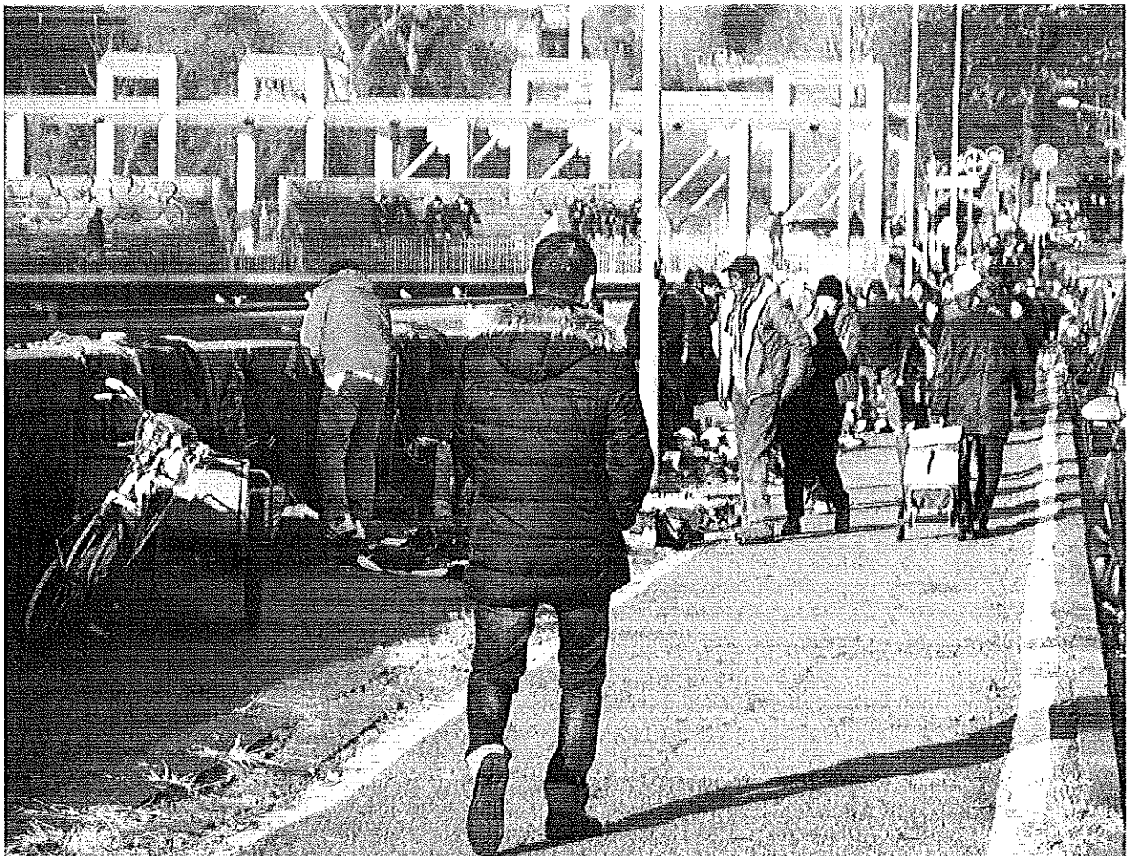
21.12.2015 Lungo Dora Napoli tratto Ponte Carpanini- Ponte Mosca