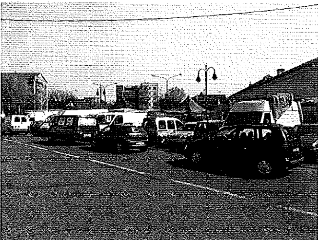
29 marzo 2014 San Pietro in Vincoli Macchine parcheggiate in seconda fila