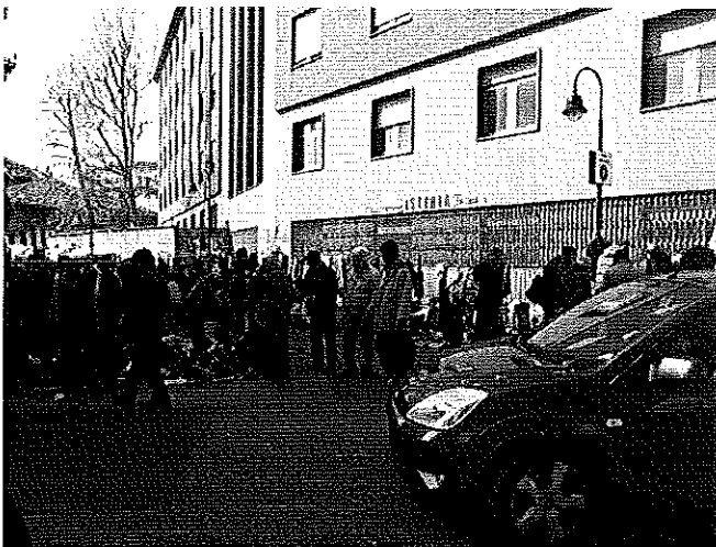
29 marzo 2014 Canale Carpanini