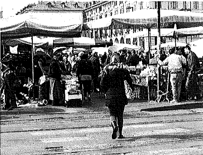
30.3.2014 Porta Palazzo