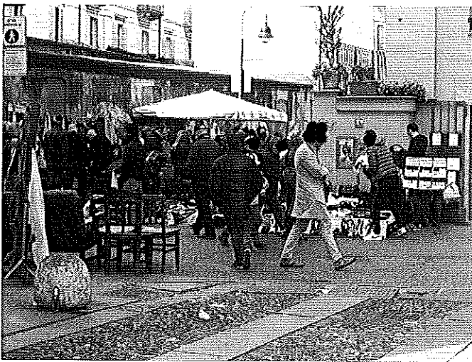
29 marzo 2014 Via Mameli-C.Carpanini