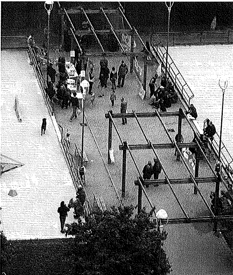
Giardini ex GFT 24 settembre 2014