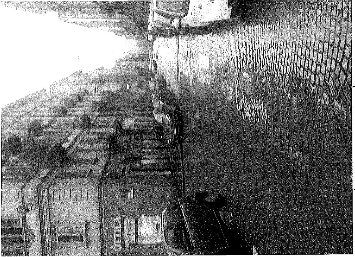
VIA SANTA GIUZIA