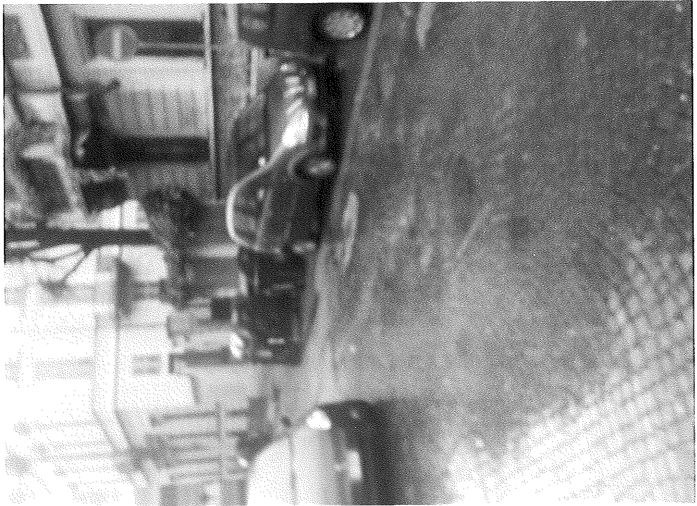
VIA SANTA GIUZIA