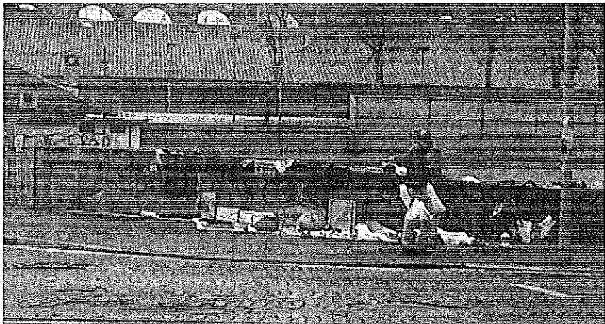
2015.2.14 Lungo Dora Napoli Ponte Carpanini