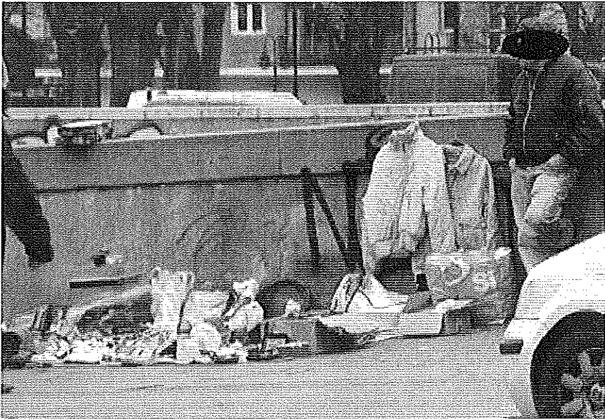
2015.2.28 Lungo Dora Napoli Ponte Carpanini