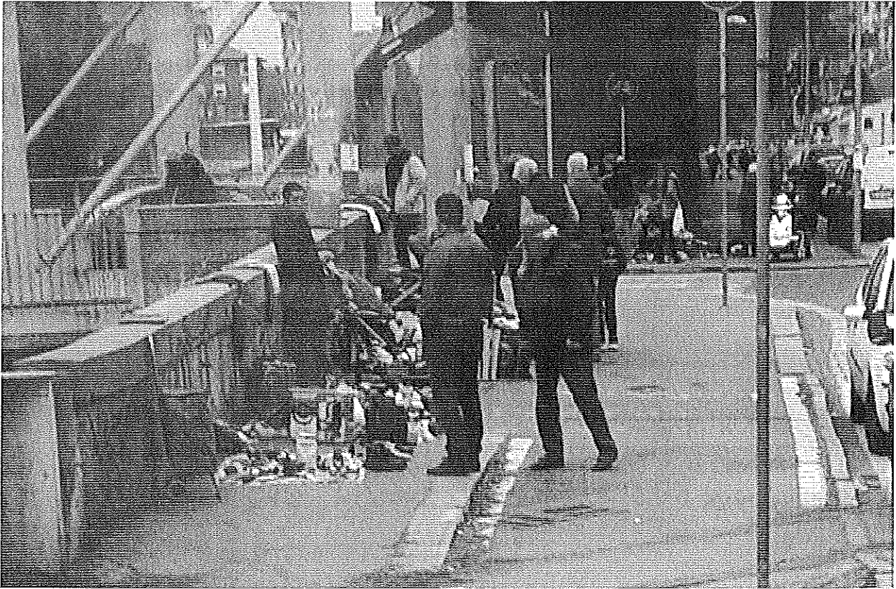
14.3.2015 L Dora Napoli Ponte Carpanini