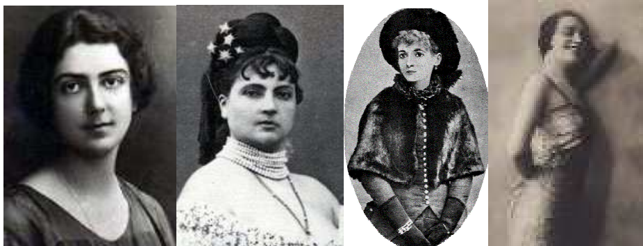
Iolanda di Savoia, Rosa Vercellana, Carolina Invernizio, Isa Bluette

DOMENICA 6 MARZO 2016 (in occasione della Festa della Donna) h. 14.00