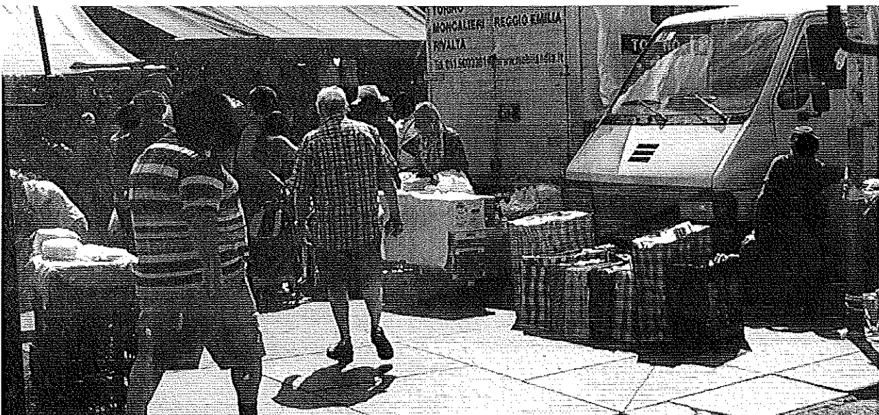
5 luglio 2014 Porta Palazzo Mercato ortofrutta