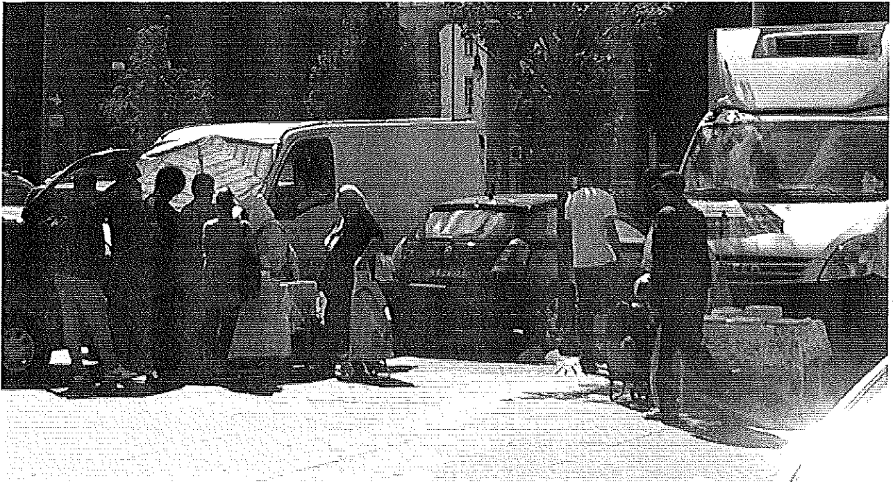
5.7.2014 Piazza della Repubblica fronte lapide Cirio