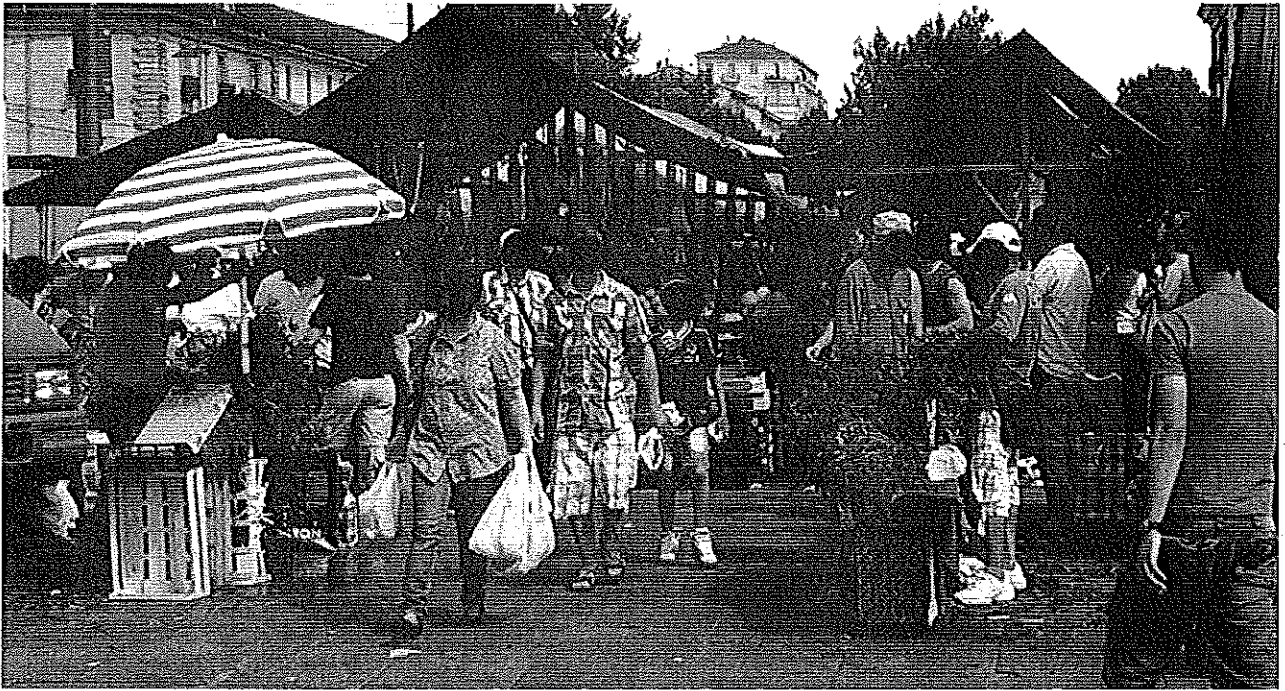
5 luglio 2014 Porta Palazzo Mercato ortofrutta