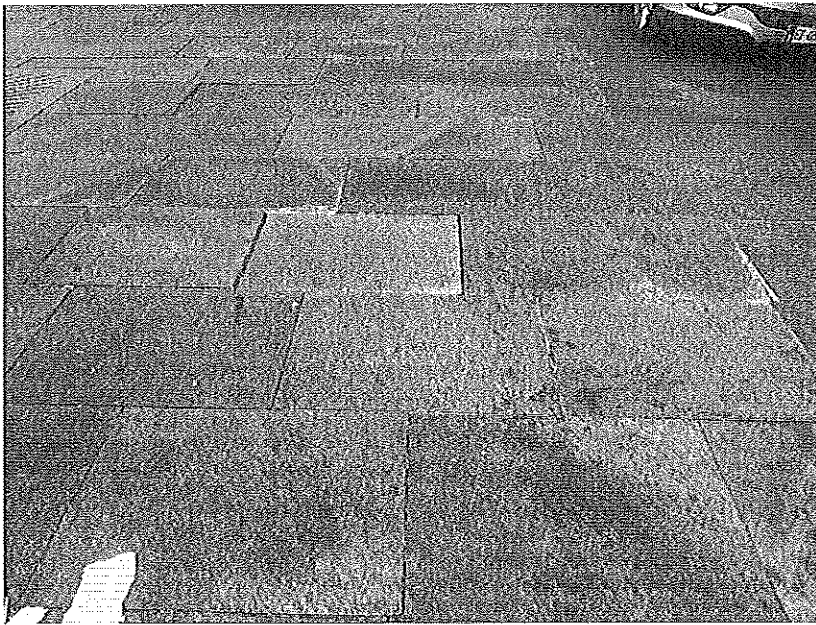
Piazzetta Cirio 9 luglio 2015