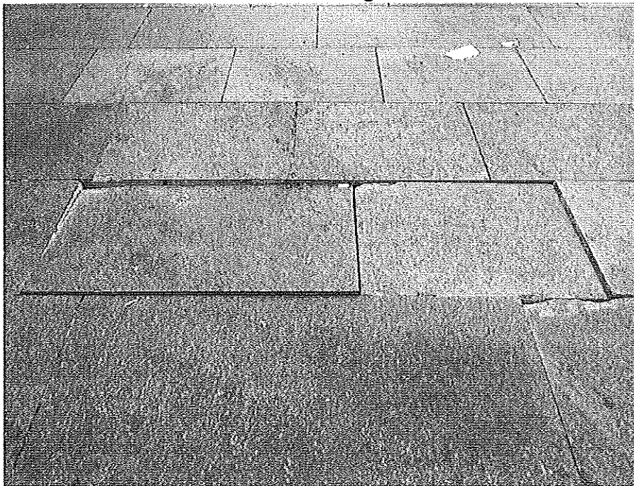
Piazzetta Cirio 9 luglio 2015