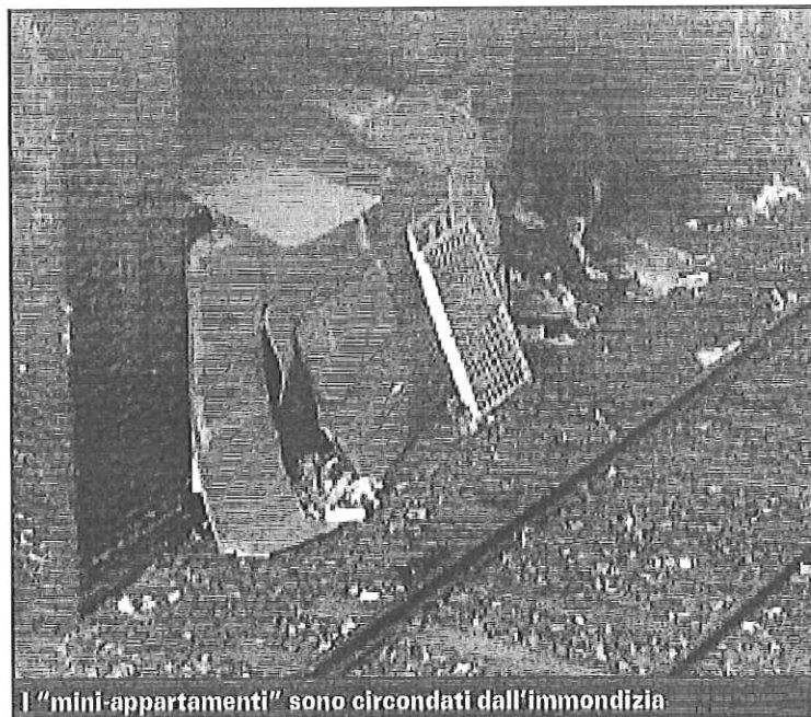
I "mini-appartamenti" sono circondati dall'immondizia

Il problema del degrado in via Saint Bon e zone limitrofe rappresenta ormai una costante alla Sette. Nel corso degli anni, infatti, sono state decine le interpellanze presentate in circoscrizione, l'ultima ad inizio di luglio. Intanto il vecchio canale continua ad essere meta ambita da