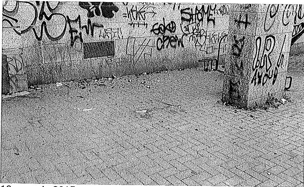
10 gennaio 2015