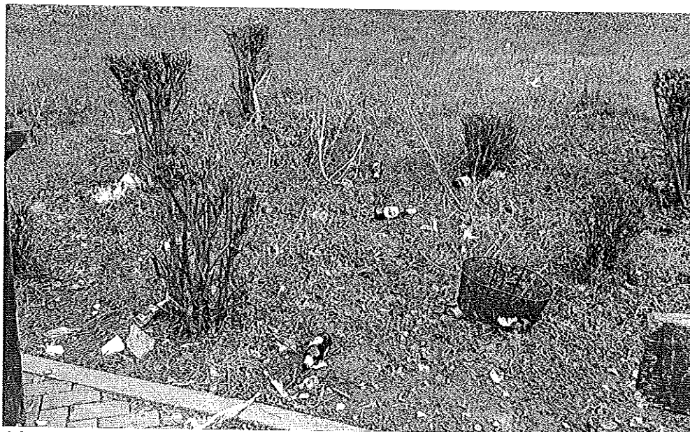
10 gennaio 2015