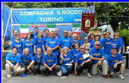
Foto di gruppo della Festa di San Rocco 2012