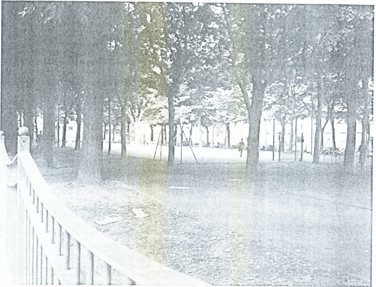
Area con rete rimossa