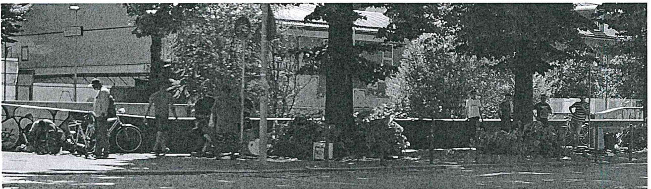
4 luglio 2020 Lungo Dora Napoli