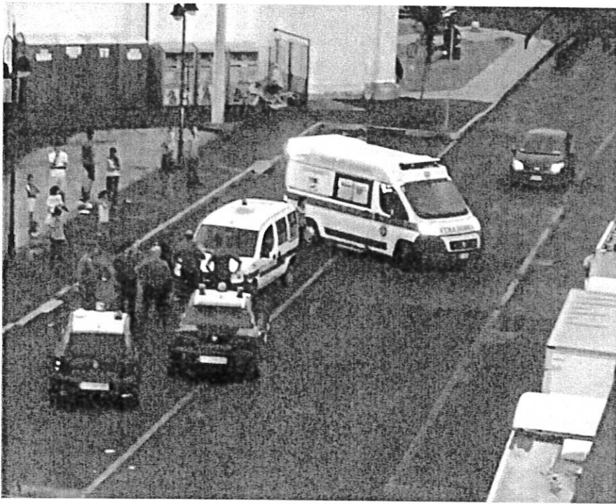
Da una pagina di Facebook il 17 agosto 2018 (ennesima rissa del venerdì)