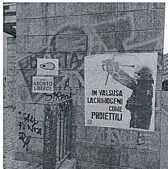
Giardini Madre Teresa di Calcutta lato Corso Giulio Cesare