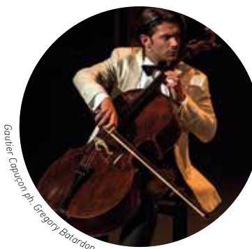
Gautier Capuçon

Gautier Capuçon, violoncello Jérôme Ducros, pianoforte