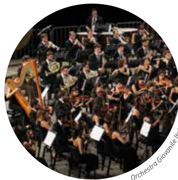
Orchestra Giovanile Italiana

In collaborazione con Fondazione Scuola di Musica di Fiesole Coro Maghini Accademia del Maggio Musicale Fiorentino