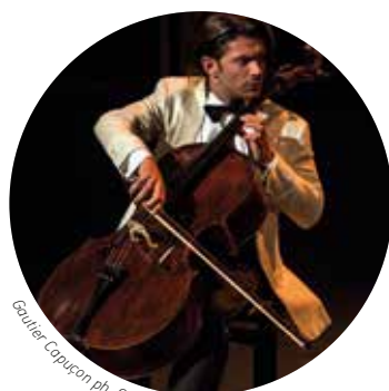
Gautier Capuçon