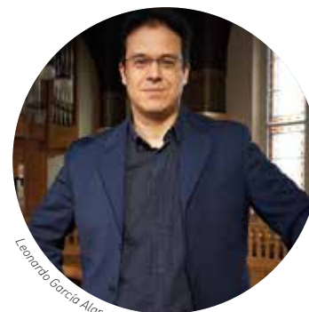
Leonardo García Alarcón