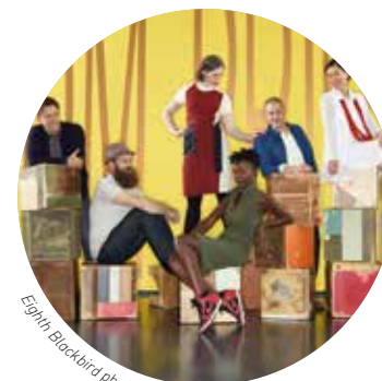
Eighth Blackbird