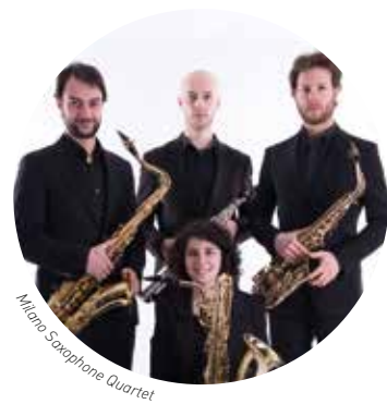
Milano Saxophone Quartet

Chiesa di San Pietro e Paolo Apostoli ore 21