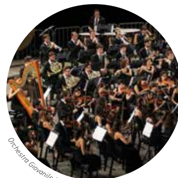
Orchestra Giovanile Italiana

In collaborazione con Fondazione Scuola di Musica di Fiesole Coro Maghini Accademia del Maggio Musicale Fiorentino