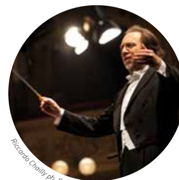
Riccardo Chailly