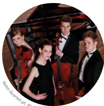
Notos Quartett