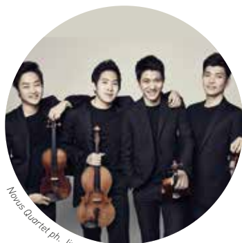
Novus Quartet

Chiesa dei Beati Federico Albert e Clemente Marchisio ore 21