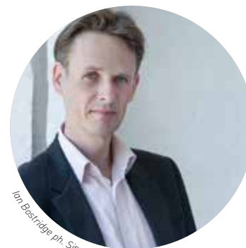
Ian Bostridge