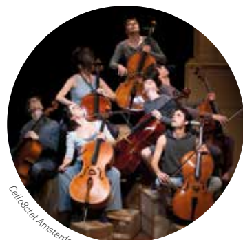
Cello8ctet Amsterdam