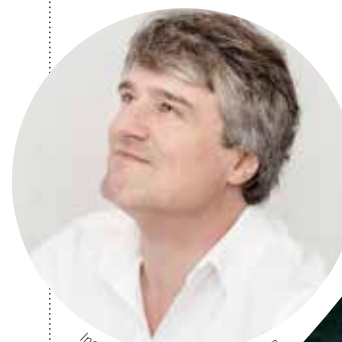
Ingo Metzmacher