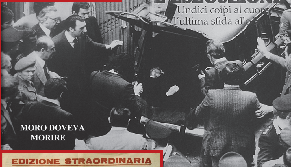
MORO DOVEVA MORIRE

Undici colpi al cuore l'ultima sfida allo