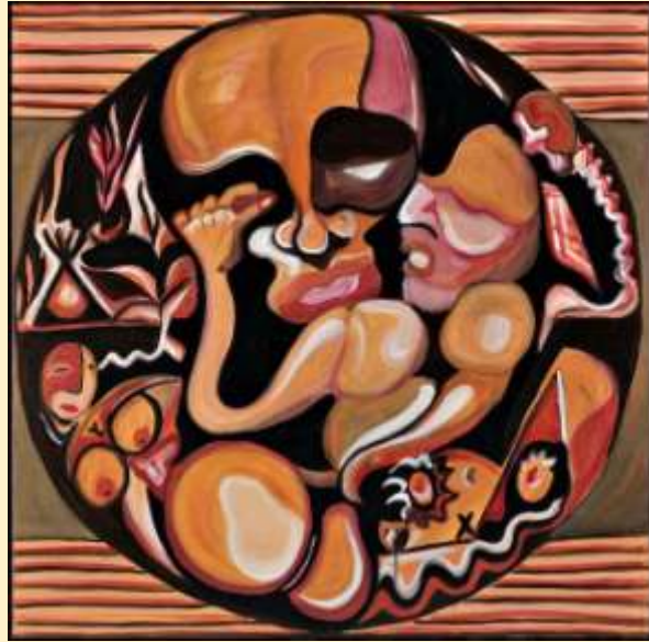
ELENA RIVAUTELLA, SENZA TITOLO