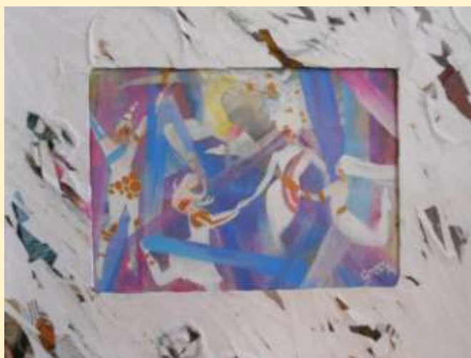
ROSARIA GRIECO, VICENDE COLORATE