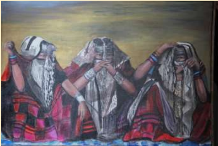
EVART SODALIZIO ARTISTICO: 1. ASCOLTO GUARDO E PARLO