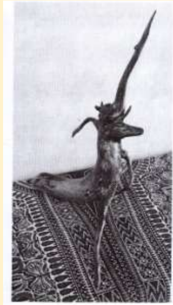
OLGA PRIOTTO, UNICORNO