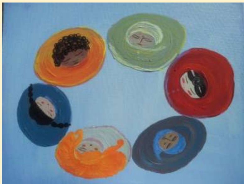
MENZIONE SPECIALE – SARA STELLA CAPOSIO, GONNE