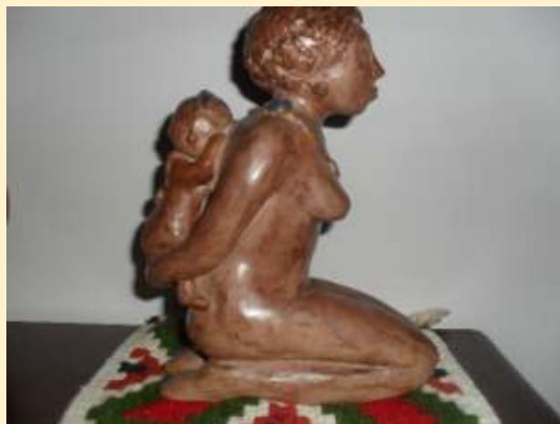
LUCIA NICOLETTA, MATERNITA'