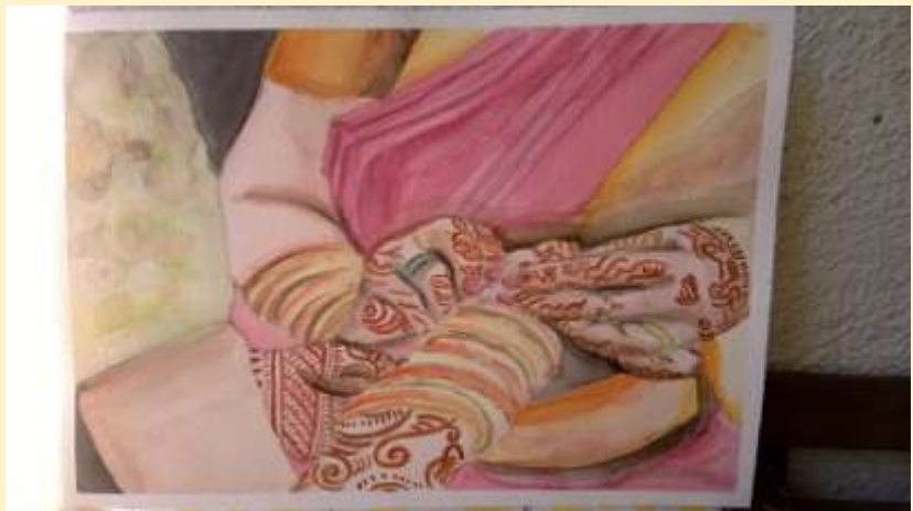
2 PREMIO – ANNA PALERMO, FUTURO 3 PREMIO – VALENTINA BOLLO, PICCOLE GRANDI ATTEZIONI