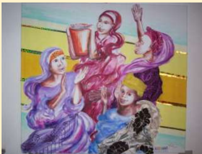
FINA CURRA', ACQUAAA!