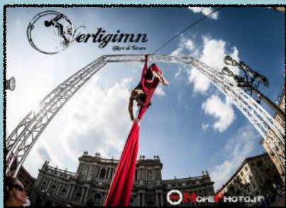
TORINO STREET STYLE. 2010/'11/'12/'13

Un evento ricorrente che avviene in collaborazione con il settore delle Politiche Giovanili in Piazza Castello.