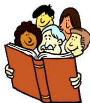
GRUPPO DI LETTURA

mercoledì 28 settembre, alle 15.00 martedì 18 ottobre e 14 dicembre, alle 15.00