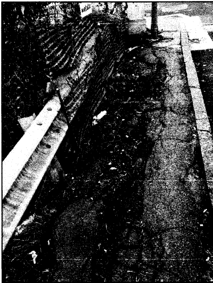
Ponte su c.so Giulio Cesare