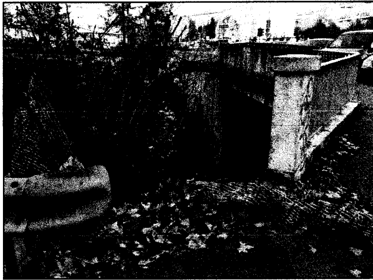
Ponte su via Mercadante