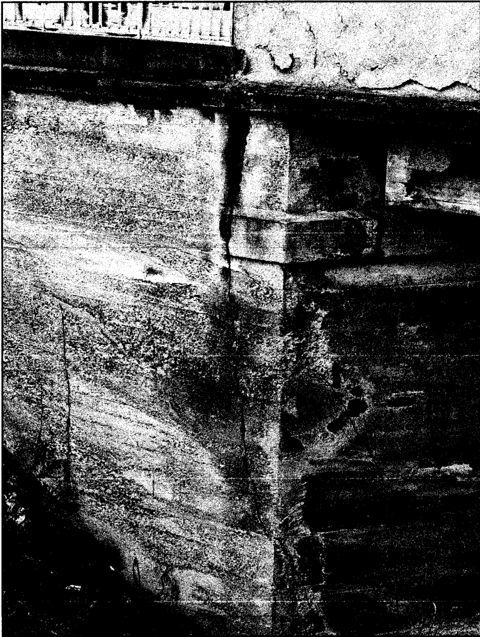
Ponte su via Martorelli