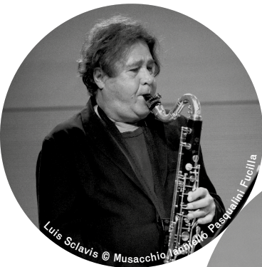
Louis Sclavis

Il progetto di Federica Michisanti è frutto di un percorso iniziato con la vittoria del Top Jazz come miglior nuovo talento italiano e del premio speciale SIAE per l'originalità della ricerca compositiva, che l'hanno portata alla conduzione, per il terzo anno consecutivo, di un ensemble formato dal suo trio e da un ospite eccezionale, Louis Sclavis, uno dei protagonisti del jazz europeo, a conferma della stima che l'artista francese ha mostrato nelle precedenti occasioni verso il lavoro della Michisanti. Il quartetto propone composizioni della contrabbassista, brani dal suggestivo respiro cameristico che attingono dalla musica colta europea e dall'avanguardia jazzistica, lasciando spazio all'improvvisazione estemporanea.