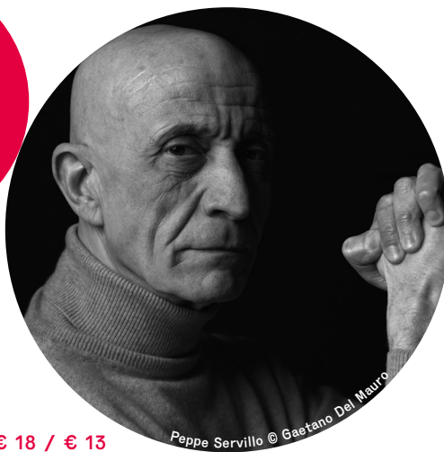
Pepe Servillo