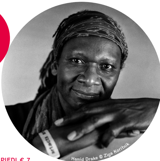
Hamid Drake