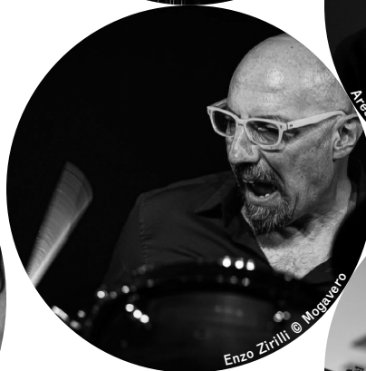
Enzo Zirilli