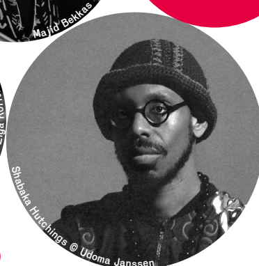
Shabaka Hutchings