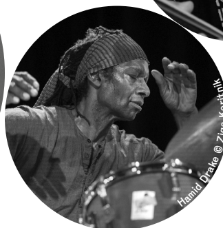
Hamid Drake