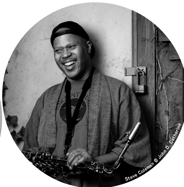
Steve Coleman