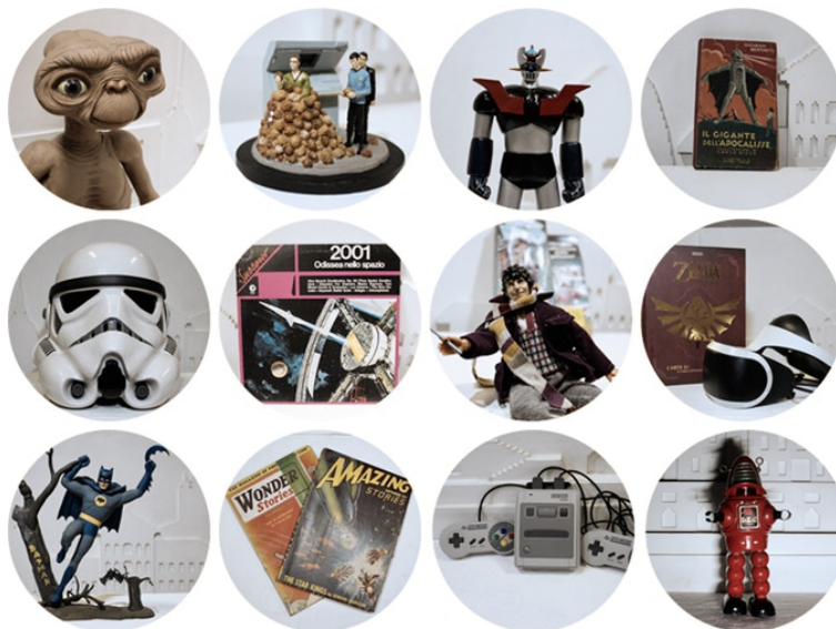
Figura 1: i temi di Loving the Alien fest

In una fantastica full immersion lunga tre giorni – 18/19/20 settembre 2020 – trasformeremo il “Parco del Fantastico” in uno spazio di incontro e aggregazione: Loving the Alien Fest , il primo festival sociale dedicato al Fantastico Moderno, all’inclusione sociale e alla rigenerazione urbana.