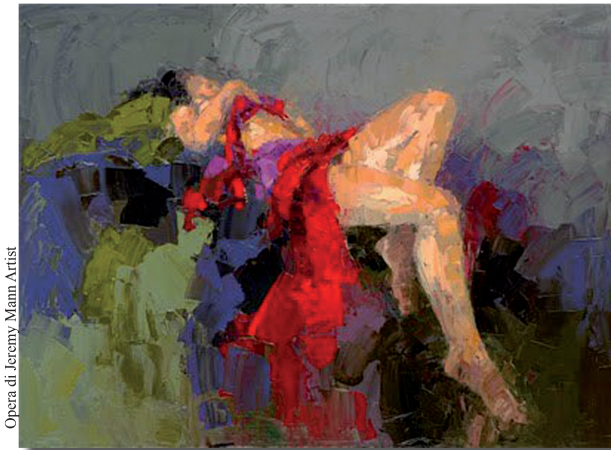
Opera di Jeremy Mann Artist

Inaugurazione Mercoledì 6 Marzo 2013 alle ore 17,00