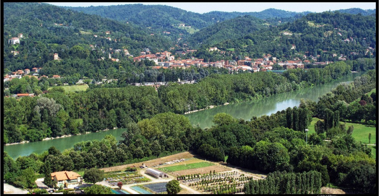
[Torino città d'acqua - foto di M. Boero - on web]