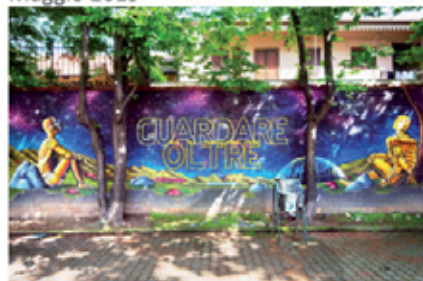
Piera Deantonio, Al di là dell'orizzonte