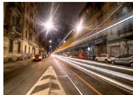
Chiara ARLOTTA: Pulpito o palpito? (Santa Signora del Suffragio e Santa Zita) Benefica (Casa Fenoglio - La Fleur ) Magic Street (via San Donato)