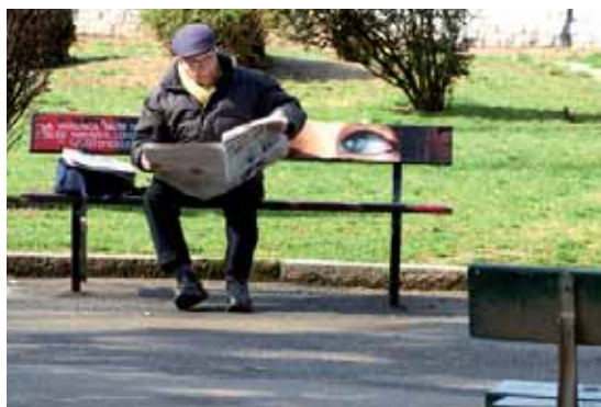
Panchina Rossa contro la violenza sulle donne, opera di Karim Cherif

(via Giacomo Medici angolo corso Svizzera)