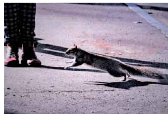
Claudia CUMINETTI: Campanile al mattino (chiesa N.S. del Suffragio e Santa Zita) Girandola di balcone (cortili via Nicola Fabrizi) Sciattolino tra i piedi (Parco Tesoriera, ingresso corso Francia)