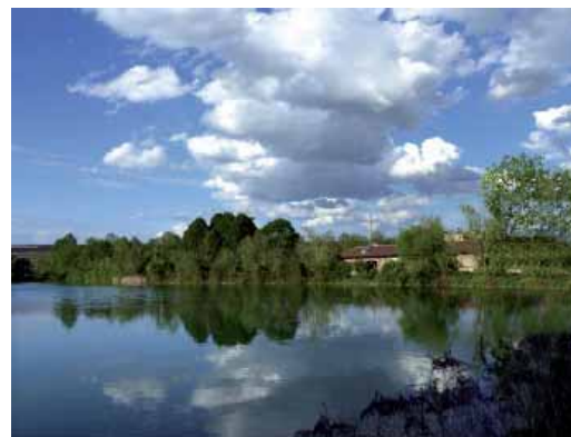
Stefano ALLOCHIS: Anatra in atterraggio (Pellerina) Crepuscolo al Parco (Tesoriera) Riflessi con nubi (Pellerina)