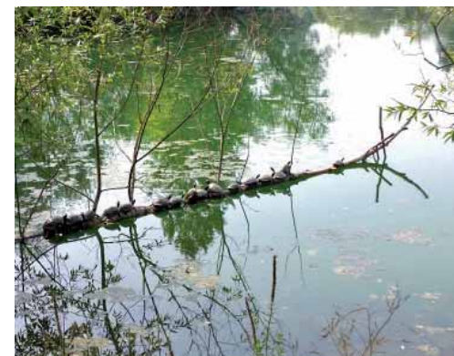
Marco DI NARDO: Ben tornato, autunno! (Parco della Pellerina) Corri che è tardi! (piazza Bernini) Dobbiamo stare vicini vicini! (Parco della Pellerina)