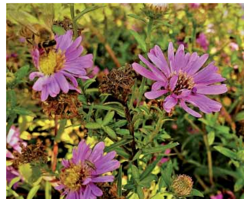
Alberto CIRAVEGNA: Passaggio segreto (Officina Verde Tonolli, via Valgioie 45) Bianco-rosso-verde (Officina Verde Tonolli) Operaia al lavoro (Officina Verde Tonolli)