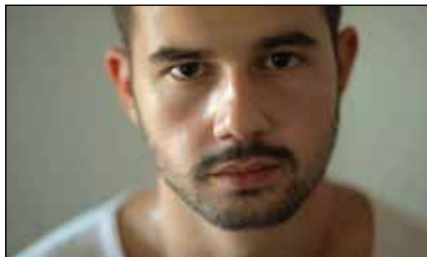
Non so perché ti odio - Tentata indagine sull'omofobia e i suoi motivi