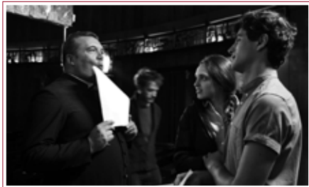
Lazzaro vieni fuori