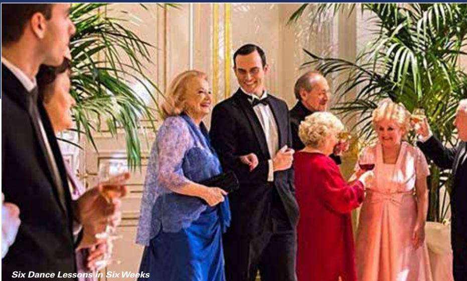
Six Dance Lessons in Six Weeks

Gli ospiti saranno annunciati sul programma pubblicato on line all'indirizzo www.tglff.it