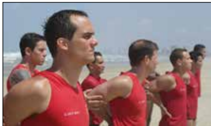
Praia do futuro

Opening: Eugenio in Via di Gioia - acoutisc folk