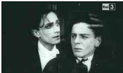
Anders als die Andern

Grazie a frammenti recuperati, a documenti e fotografie scovati negli archivi privati, la versione restaurata dal Museo del Cinema di Monaco del primo film a tematica apertamente omosessuale della storia, girato nel 1919 e prodotto da Magnus Hirschfeld. All'epoca ne fu impedita la distribuzione e, poi, il regime nazista ne bruciò le copie. Coraggiosa denuncia contro il "Paragrafo 175", la legge contro l'omosessualità vigente allora in Germania. Interpretato dall'attore gay Conrad Veidt. Culto assoluto.