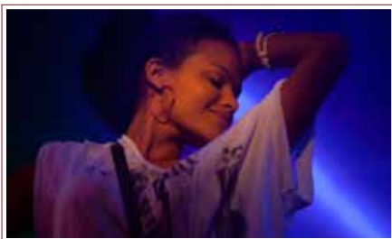
While You Weren't Looking

CONCORSO LUNGOMETRAGGI/FEATURE FILM COMPETITION