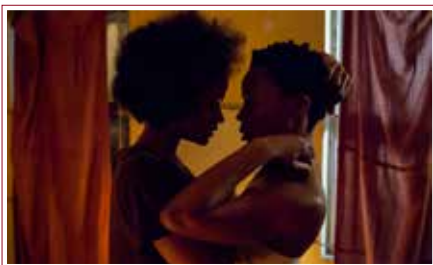
While You Weren't Looking

Opening: Marie and the Sun - acoustic duo