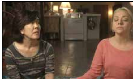
Eat with Me