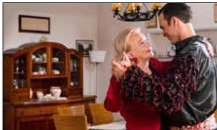
Six Dance Lessons in Six Weeks

Il ritorno sul set della favolosa Gena Rowlands, 85 anni. Nel film interpreta Lily, una vedova annoiata e un po' petulante con una bella casa in Florida che, per ammazzare il tempo, si è messa in testa di prendere lezioni di danza. Con il suo insegnante Michael, un ex ragazzo del coro italoamericano e gay, le cose, all'inizio, sono un disastro ma, ballando ballando, tra i due scatta l'intesa. Commedia sulla tolleranza che nel cast vanta anche Julian Sands e, come direttore della fotografia, il grande Vilmos Zsigmond.