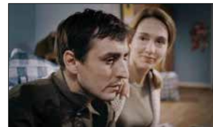
Unter der Haut