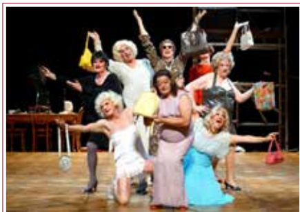
Gardenia - Bevor der letzte Vorhang fällt

REGIA: BRICE CAUVIN (FRANCIA, 2014, DCP, 97', COL.)