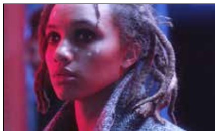
Vow of Silence