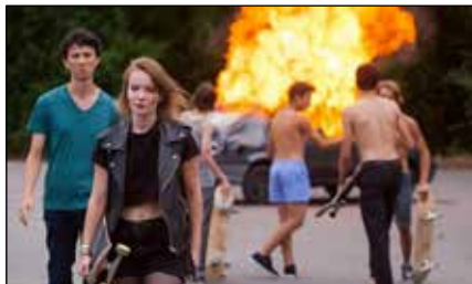
The Smell of Us