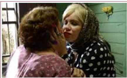
Vestido de novia