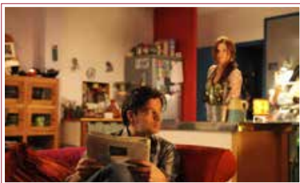
L'Art de la fugue