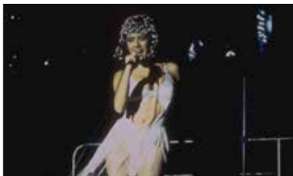
54: The Director's Cut