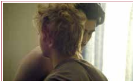
Aban + Khorshid