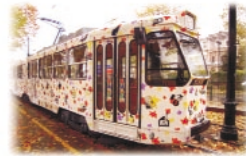
Ristorcolor Tram del gusto