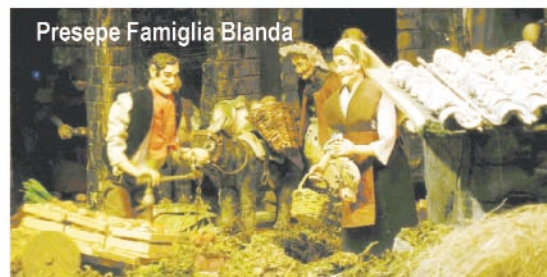
Presepe Famiglia Blanda

5 Dicembre 2004 - 6 Gennaio 2005 Per rivivere l'antica magia del Natale, presso il CAD Bottega delle Rane, c. Svizzera 61, presepe meccanico della Famiglia Blanda, tutti i giorni 9-19. Due mattine alla settimana Laboratorio di Presepismo per alunni Scuole Elementari e Medie