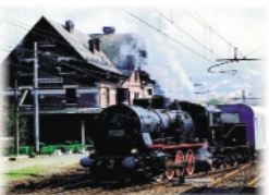
Treno storico a vapore