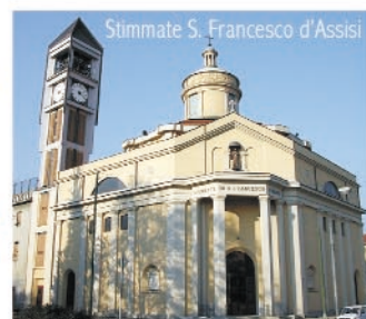
Stimmate S. Francesco d'Assisi

Chiesa Stimmate di S. Francesco d'Assisi via Ascoli 32 Sabato 18 Dicembre ore 21 Canti natalizi e musiche liturgiche