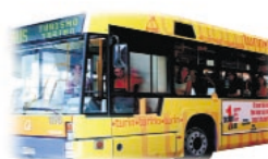
Turismo Bus Torino