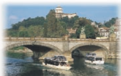
Navigazione sul Po