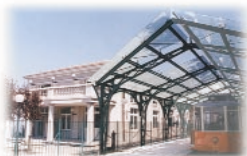
Tramvia a dentiera Sassi - Superga