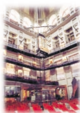
Ascensore panoramico Mole Antonelliana