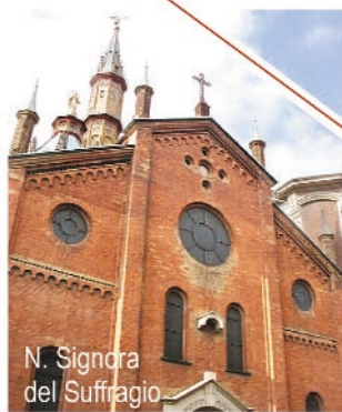
N. Signora del Suffragio