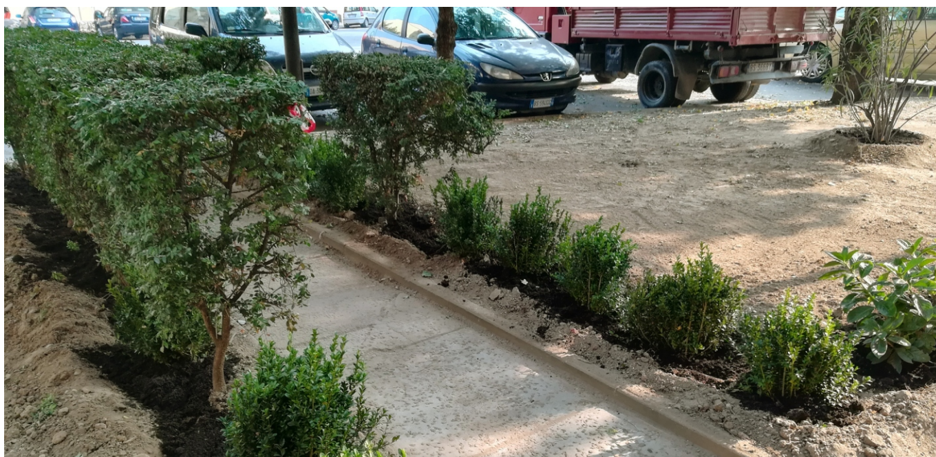
Torino, largo Valgioie, 18 ottobre 2017