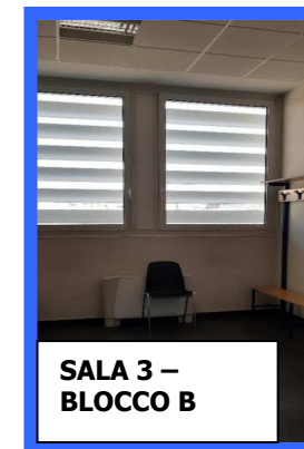
SALA 3 – BLOCCO B