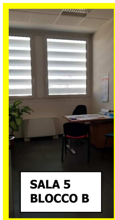
SALA 5 BLOCCO B