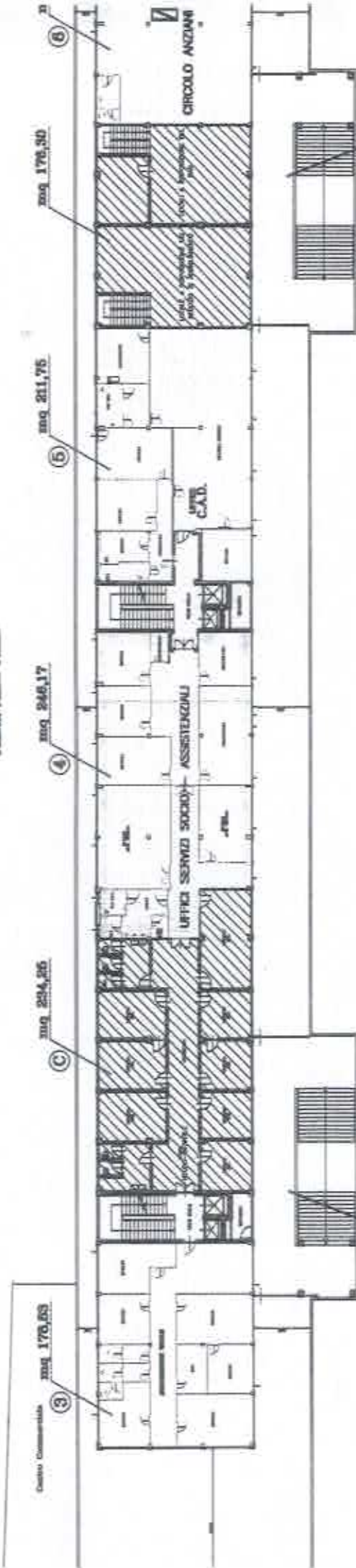
PIANTA PIANO FREDDO