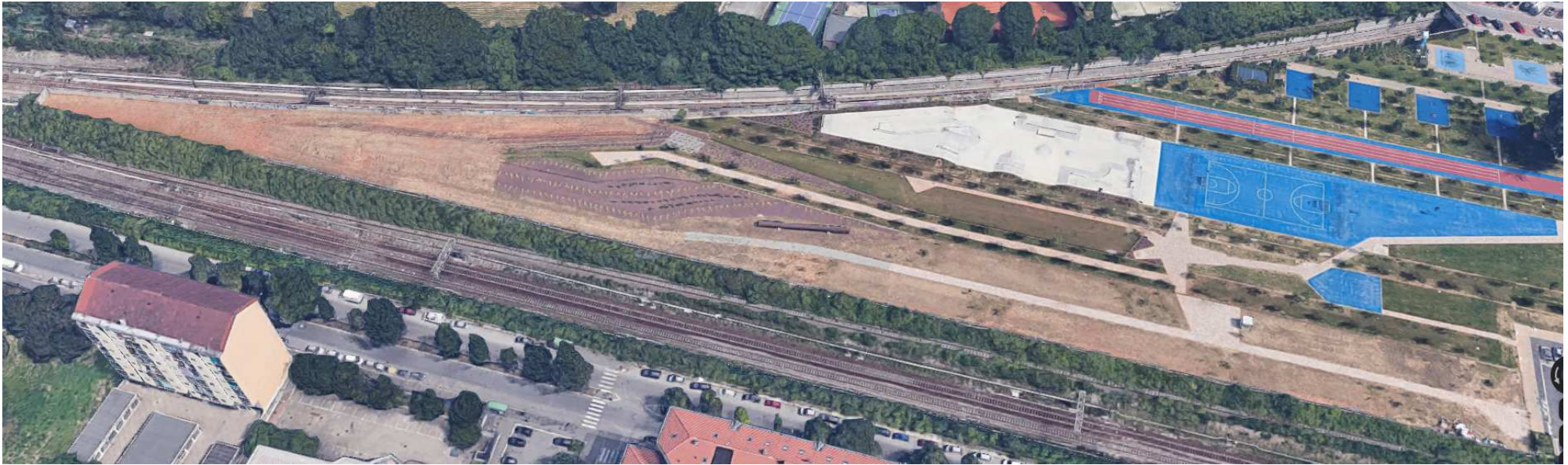
Vista aerea dell'orto, in basso la ferrovia di via Tirreno