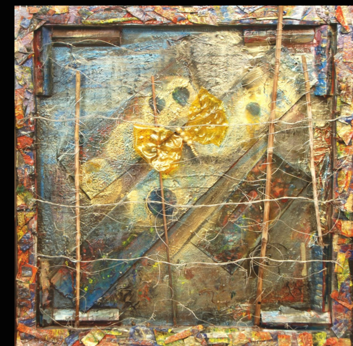
"Libertà" 100x100 cm - opera polimaterica di Silvana Maggi