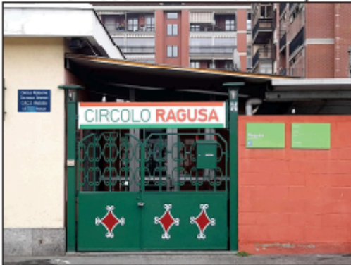
INGRESSO DA VIA RAGUSA 27/A