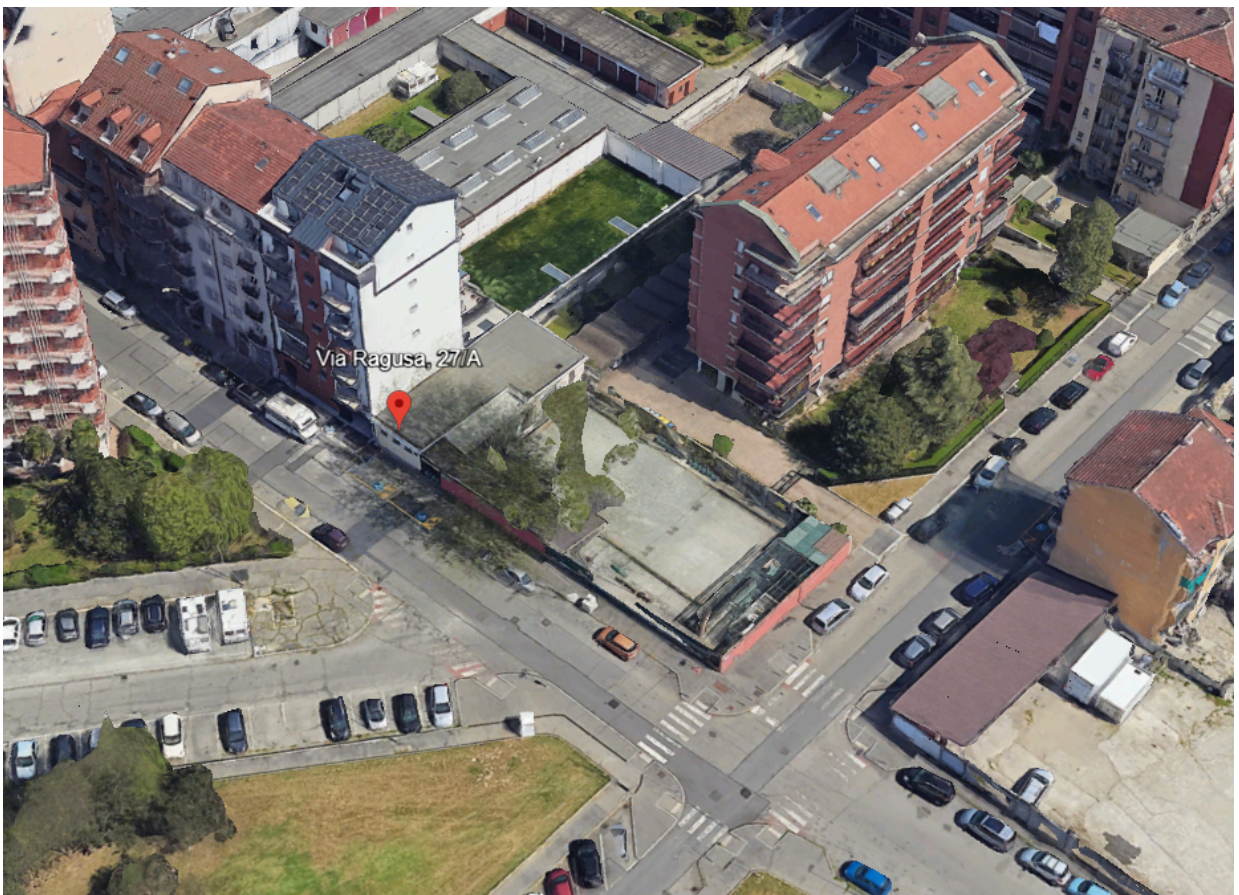
Vista impianto da Google earth