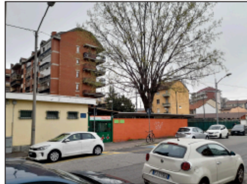
VISTA SU VIA RAGUSA