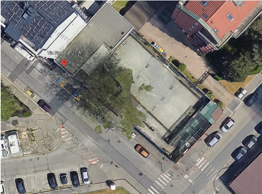
Vista aerea impianto