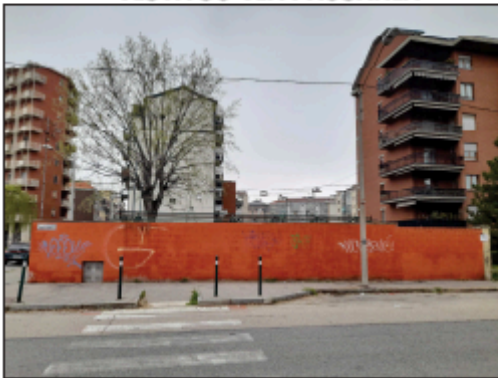
VISTA SU VIA PAUSANIA