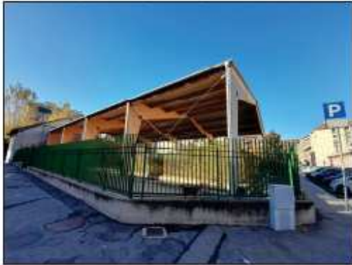
VISTA LATO VIA GARLANDA